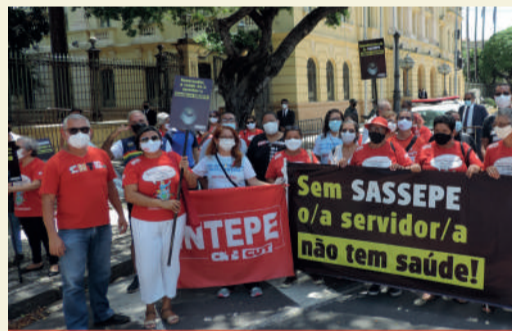
Sindicato firme na luta institucional e na mobilização da base nas ruas

Sensível aos apelos da categoria, o Sintepe realizou reuniões virtuais e participou de manifestações nas ruas, ao lado de outros sindicatos, cobrando melhorias no SASSEPE.