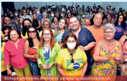
Sintepe promoveu encontros para os/as aposentados/as

Valorizando o trabalho e o legado dos aposentados e aposentadas, o