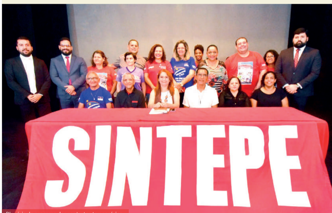
Plenária do processo dos contratos temporários

O Sintepe ganhou na Primeira Instância da Justiça em Pernambuco o direito dos profissionais da educação Contratados por Tempo Determinado (CTDs), que trabalharam entre abril de 2017 e junho de 2021, de receber a complementação do valor do Piso Salarial do Magistério que