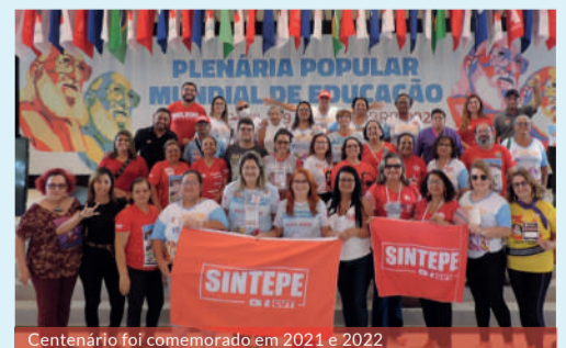
Centenário foi comemorado em 2021 e 2022

tempos futuros" na UFPE e do Encontro da Rede de Mulheres Trabalhadoras em Educação da América Latina. O Sindicato foi um dos promotores das aulas virtuais "Paulo Freire nas Escolas", que distribuiu mais de 25 mil livretos com textos científicos sobre a obra de Paulo Freire, discutidos de forma online.