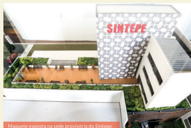
Maquete exposta na sede provisória do Sintepe

Uma comissão especial do Sintepe acompanha periodicamente o andamento da obra. O novo prédio do Sindicato terá amplo auditório, um rooftop com vista externa e espaços com plena acessibilidade. A previsão é que a nova sede possa ser entregue ainda em 2023.