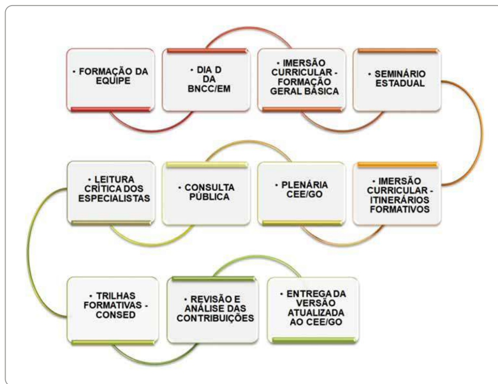
Figura 1: Fluxo do processo de elaboração do DC-GOEM

O fluxo do processo de elaboração do DC-GOEM, sintetizado na imagem abaixo, está presente nas três versões do documento. A ilustração indica que a proposta avançou após a realização do Seminário Estadual, e que, a partir daí, recebeu contribuições externas, ou seja, 'a leitura crítica dos especialistas' foi a última fase antes de o documento preliminar ser submetido à consulta pública.